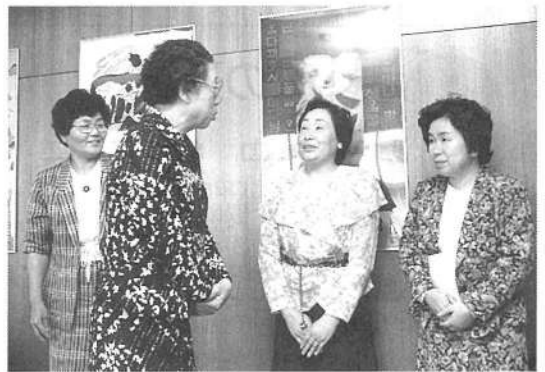
(6) 大先輩と同窓会役員