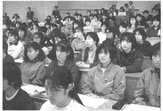
(4) 真剣に大先輩の話を聴いて