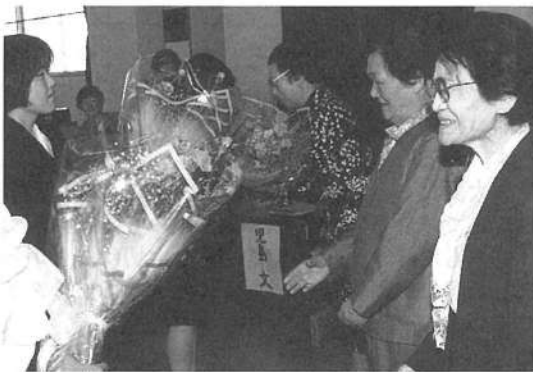
(5) 同窓会より花束贈呈