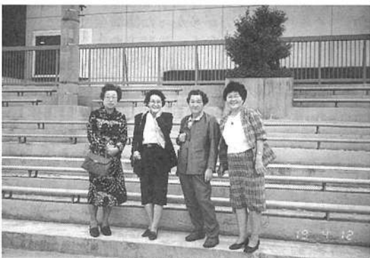
(7) 若き頃トレーニングにはげんだ懐しい鶴舞グラウンドにて