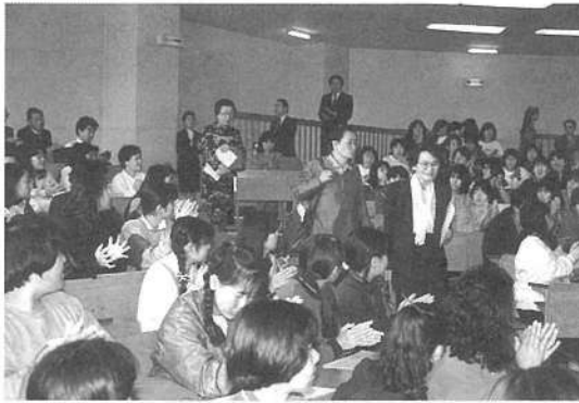
(3) 大先輩入場拍子で歓迎