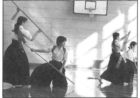
上 第8回中京女子大学同窓会総会（スポーツサイエンスセンター〔健康の女神〕）