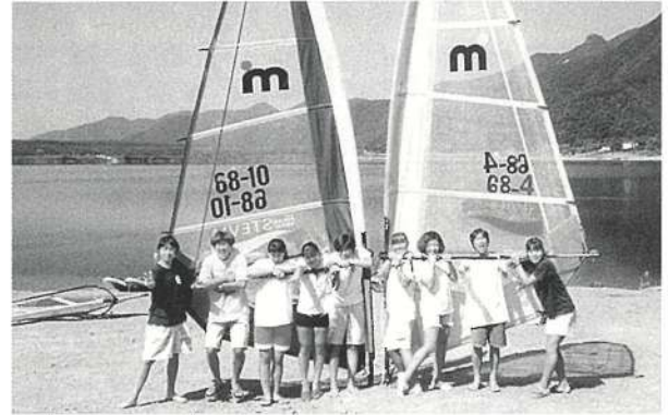
▲ボードセーリング同好会