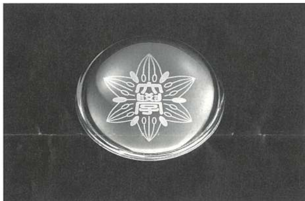
同窓会からの卒業記念品（ペーパーウエイト）の写真